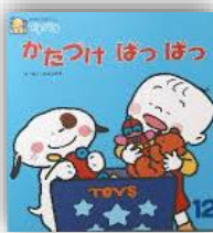
作・絵: こみまさやす 出版: ひかりのくに