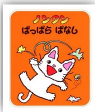
作・絵: キヨノサチコ

5月30日は語呂合わせで「ごみゼロ」の日。1970年代の「530(ゴミゼロ)運動」を機に、「ゴミを拾うことで、ゴミを捨てない心を育てる」ことを目的に制定されました。現在では5月30日~6月5日を「ごみ減量・リサイクル推進週間」として全国各地で様々な活動が行われています。そこで今月はゴミや環境問題、SDGsなどに関する本をいくつか紹介します。